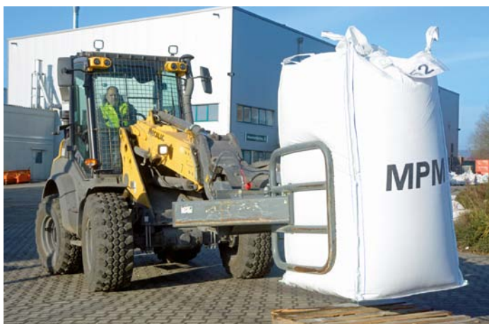
→ Les matières premières recyclées sont ensuite emballées dans des big-bags et chargées sur des camions.

dans les silos correspondants, elles transfèrent le matériau au sein de l'entreprise, le transbordent par exemple dans les installations de broyage et les cribles, et chargent enfin les matières premières extraites dans des big-bags ou palettes sur les camions. L'une des deux AT est surtout conduite par le collaborateur Udo Naumann: « Les marchandises chargées ont souvent un poids élevé, les caisses en cuivre remplies pèsent environ 1,1 tonnes. C'est pourquoi une grande stabilité est importante – et l'AT 900 remplit ces critères. » En outre, une grande hauteur de charge est primordiale. Avec sa cabine panoramique, une hauteur maxi d'obstacle de 4,67 mètres, son bras télescopique avec cinématique en Z PLUS ainsi qu'une charge de basculement de 3470 kg, elle exploite pleinement ses atouts. La motorisation de 75 ch est également bien adaptée à la machine. « En outre, il est important pour moi que le véhicule ait quatre roues directrices », conclut Naumann. Tous les graisseurs sont bien accessibles, la maintenance est sans problème. Pour lui, l'AT 900 est devenue un partenaire incontournable pour l'utilisation quotidienne chez MPM.